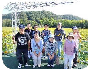
ひまわり公園見学(湖畔)