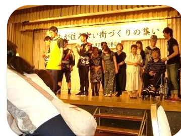
網走市手をつなぐ育成会様ビールパーティーにて贈呈式

リングプル収集運動への市民の皆様の温かな想いを強く心に受け止め、これからの社会貢献活動に努めて参りたいと思います。