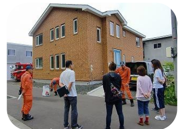
プレジール消火訓練