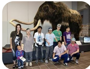
北方民族資料館見学