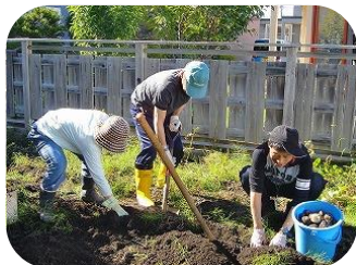
ラポール菜園・芋収穫

利用者皆さんと共に色々な野菜を植え付け、収穫を楽しみ、昼食のおかずとして美味しく戴く事ができました。