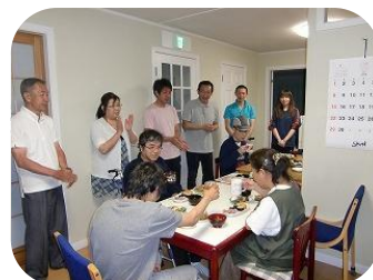
グループホームプレジール