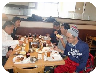
お花見会(ウエスタン)