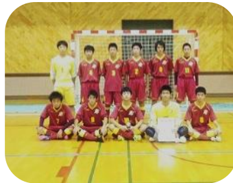
網走ジュニアユースFC