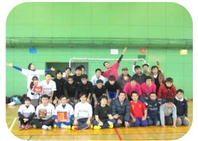
チャレンジドフットサル in 網走

健康増進・社会順応性の向上『仲良くフットサル、心の病を改善』を目的として、今年度は道東地区交流戦参加の為に帯広・釧路遠征も行い、11月には網走市で交流戦を初開催いたしました。