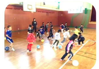
キッズサッカースクール