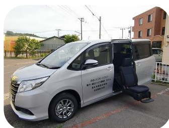
シルバー色のノアです！