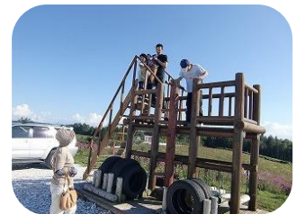
フロックス公園見学